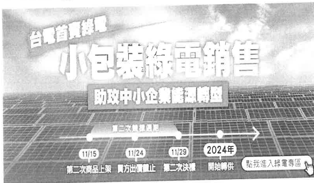
台電公司小額綠電標售期程

國際淨零碳排趨勢日漸抬頭，國內企業對綠電及憑證之採購需求快速攀升，經濟部標準檢驗局(下稱標準局)為協助綠電暨憑證供需雙方交易，提出多元解決方案，訂定「國營事業案場再生能源電力及憑證媒合服務作業程序」，並於國家再生能源憑證中心(下稱憑證中心)官網打造嶄新「綠電競標區」，與台灣電力股份有限公司(下稱台電公司)合作，供台電公司推出之「小額綠電銷售試辦計畫」使用。台電公司規劃 112 年 11 月 15 日於標準局憑證中心綠電媒合平台上架自建綠電供企業競標，歡迎各企業參與競標購買綠電。